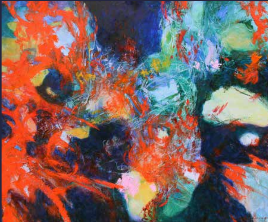
Vivement l'Afrique / Huile sur toile de 61 X 76 cm Oeuvre de Benoît Lévesque www.benoitlevesqueart.com Utilisée avec permission. Tous droits réservés 2022.

Bas Saint-Laurent Centre-du-Québec Chaudière-Appalaches Estrie