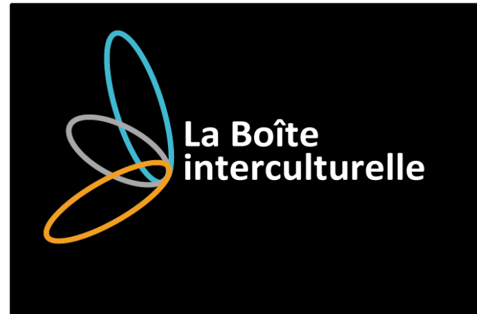
Logo officiel pour utilisation sur fond foncé

Le logo doit toujours être entouré d'une zone de dégagement minimale. Une marge de sécurité minimale, équivalente à la hauteur du « L », est tracée autour du logo pour créer la limite invisible de la zone d'isolement.